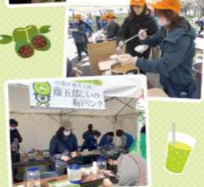
うれしい振る舞い