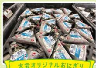
大会オリジナルおにぎり