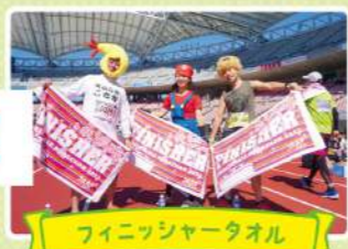
フィニッシャータオル