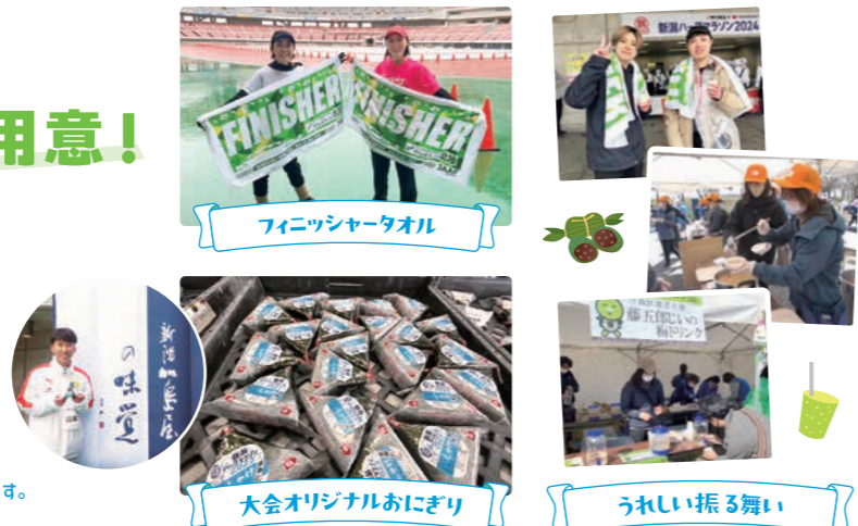
フィニッシュタオル